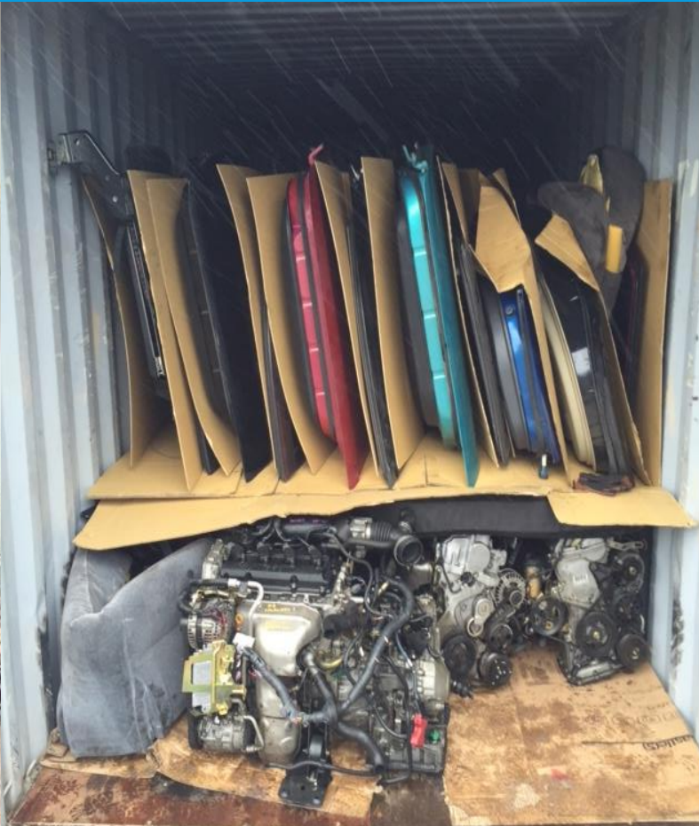
중고 자동차 부품 VANNING 작업