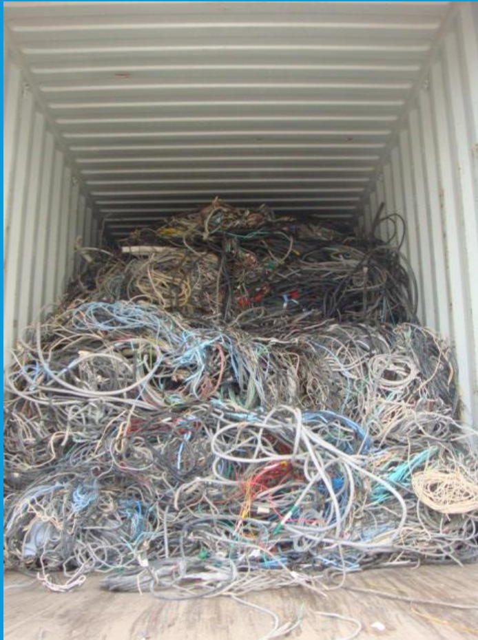
피복동선 SCRAP VANNING 작업